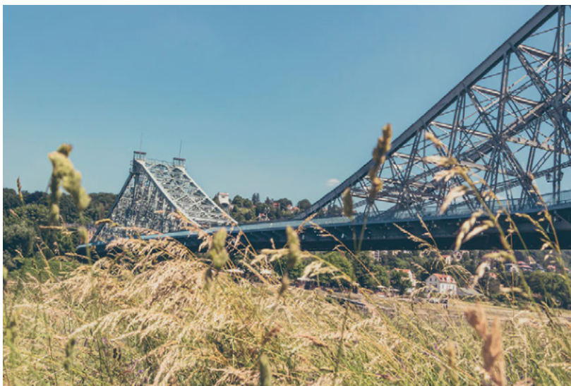
Dresden Blasewitz – Blaues Wunder