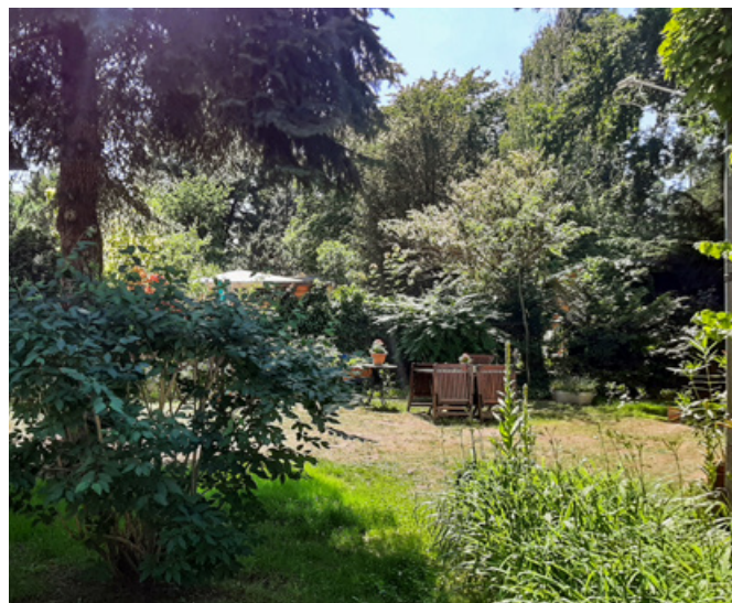
Gemeinschaftlich genutzter Garten